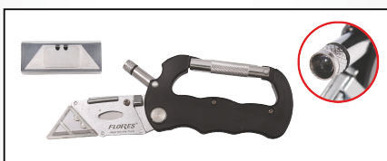
CUTTER TIP BRICEAG