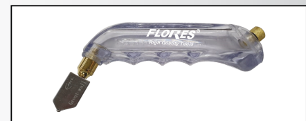
DIAMANT INCLINAT PENTRU TAIAT STICLA CU ULEI