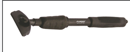
CUTTER CU MANER LUNG SI RAZUIITOR