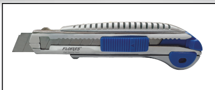
CUTTER GRI DIN PLASTIC