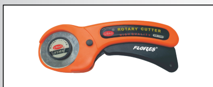
CUTTER ROTUND PENTRU MOCHETA