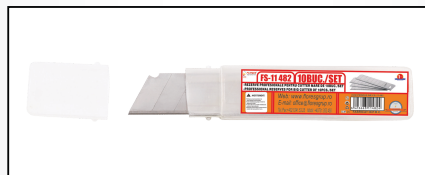
REZERVE PROFESIONALE PENTRU CUTTER MARE