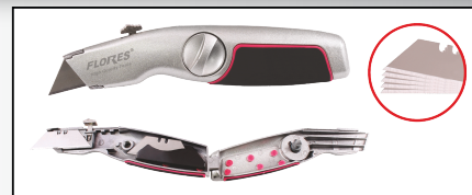
CUTTER DIN ALUMINIU INCLINAT