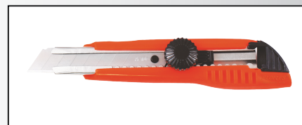
CUTTER DIN PLASTIC CU SURUB