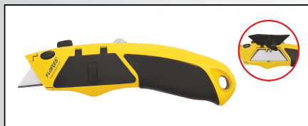
CUTTER DIN ALUMINIU MULTIFUNCTIONAL