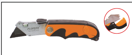
CUTTER TIP BRICEAG CU MANER CAUCIUCAT