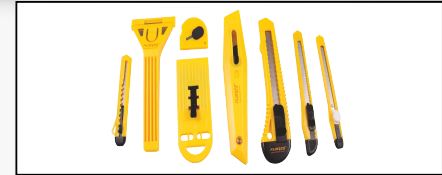
SET CUTTER HOBBY