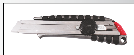
CUTTER PROFESIONAL DIN ALUMINIU CU SURUB