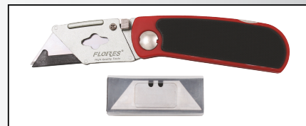
CUTTER TIP BRICEAG