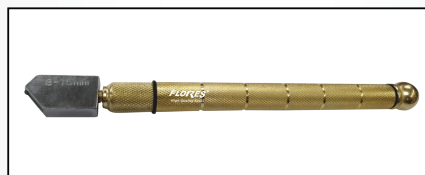
DIAMANT PENTRU TAIAT STICLA CU ULEI