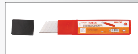
REZERVE PENTRU CUTTER MARE