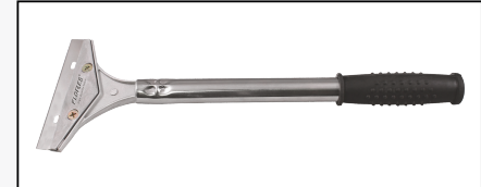
CUTTER CU MANER SI RAZUIITOR