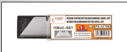
REZERVE PENTRU CUTTER ALUMINIU