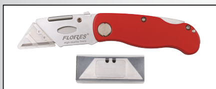
CUTTER DIN ALUMINIU TIP BRICEAG