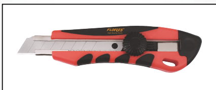
CUTTER DIN PLASTIC CAUCIUCAT CU SURUB