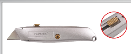
CUTTER DIN ALUMINIU