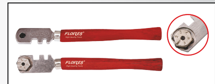
DIAMANT PENTRU TAIAT STICLA BOSSINI