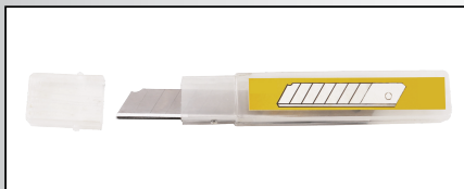
REZERVE PENTRU CUTTER MIC