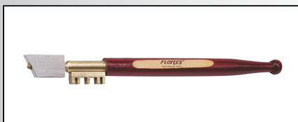
DIAMANT PENTRU TAIAT STICLA