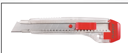
CUTTER CU PROTECTIE METALICA