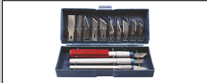
SET CUTTER HOBBY