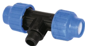
Teu pentru apa (PHD) (PIULITA+FE)