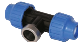
Teu pentru apa (PHD) (PIULITA+FI)