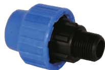
Mufa pentru apa (PHD) Fe