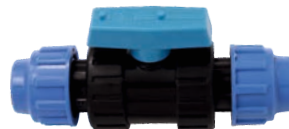
Robinet trecere pentru (PHD) cu holender