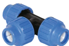
Teu redus pentru apa (PHD) (P+P+P)