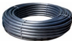
Teava pentru apa PHD