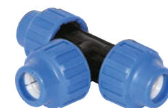
Teu pentru apa (PHD)