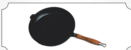
Tigale rotunda din fonta cu coada