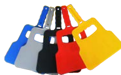
Paleta pentru gratar - (Y-141)