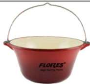
Ceaurn turnat din fonta emalat