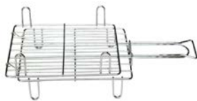
Gratar dublu pentru friptura