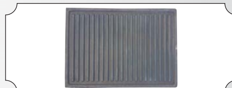
Placa din fonta pentru BARBEQUE