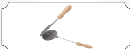
Presa din fonta cu manere pentru saratele