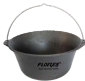
Ceaurn turnat din fonta