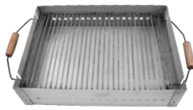
Gratar pentru Camping cu manere din lemn (50CMx36CM)