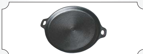
Disc din fonta rotund de 34CM