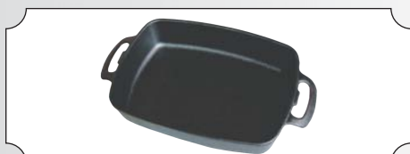
Tava din fonta