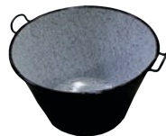
Ceaurn emalat cu manere