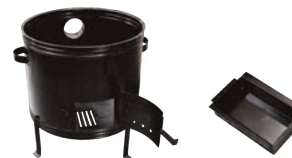
Suport rotund pentru ceaurn