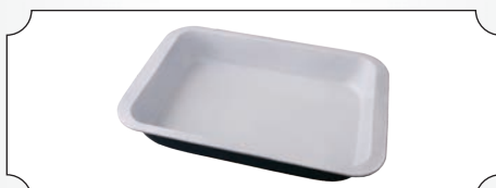
Tava emallata din metal