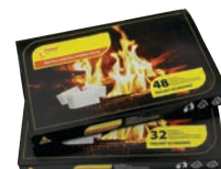
Pastile albe pentru aprins focul