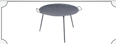
Disc pentru prajit din tabla