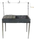
Gratar pentru Camping cu rotisor (50CMx80CM)