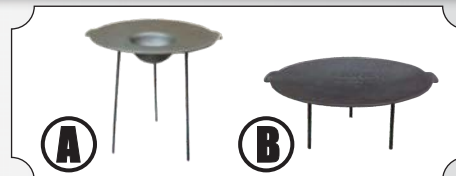
Disc din fonta