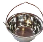
Ceaurn din inox gros