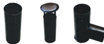
Set cot si burian cu palarie pentru suport ceaurn