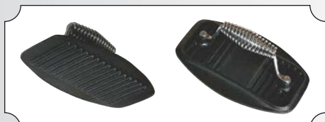
Presa din fonta cu maner pentru carne