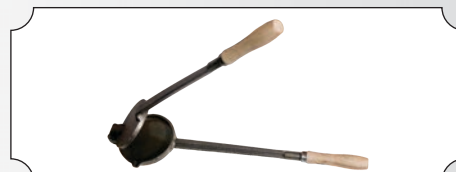
Presa din fonta cu manere pentru slanina