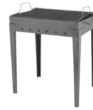
Gratar pentru curte