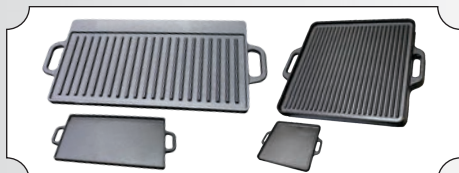
Disc pentru fonta dreptunghiular cu 2 fete