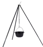
Suport telescopic pentru ceaurn