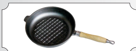
Tigale rotunda din fonta cu coada