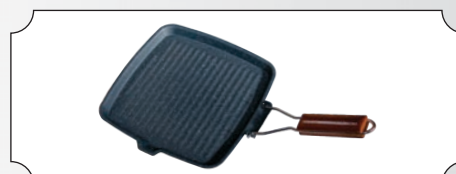
Tigale dreptunghiulara grill din fonta cu coada