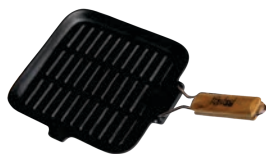
Tigale grill din fonta cu coada CARBONSTEEL