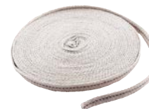
Fitul pentru felinar