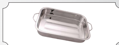
Tava din inox